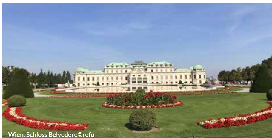
Wien, Schloss Belvedere

Schloss Gödöllő (auch Schloss Grassalkovich), liegt ca. 25 Kilometer nordöstlich der Hauptstadt Budapest in der Stadt Gödöllő. Das Schloss wurde im 18. Jahrhundert erbaut und diente später als Residenz für die österreichische Kaiserin und ungarische Königin Sisi. Schloss Gödöllő - Sisi's Lieblingsschloss - ist eines der größten Barockschlösser der Welt und ist größtenteils wieder in seiner ehemaligen